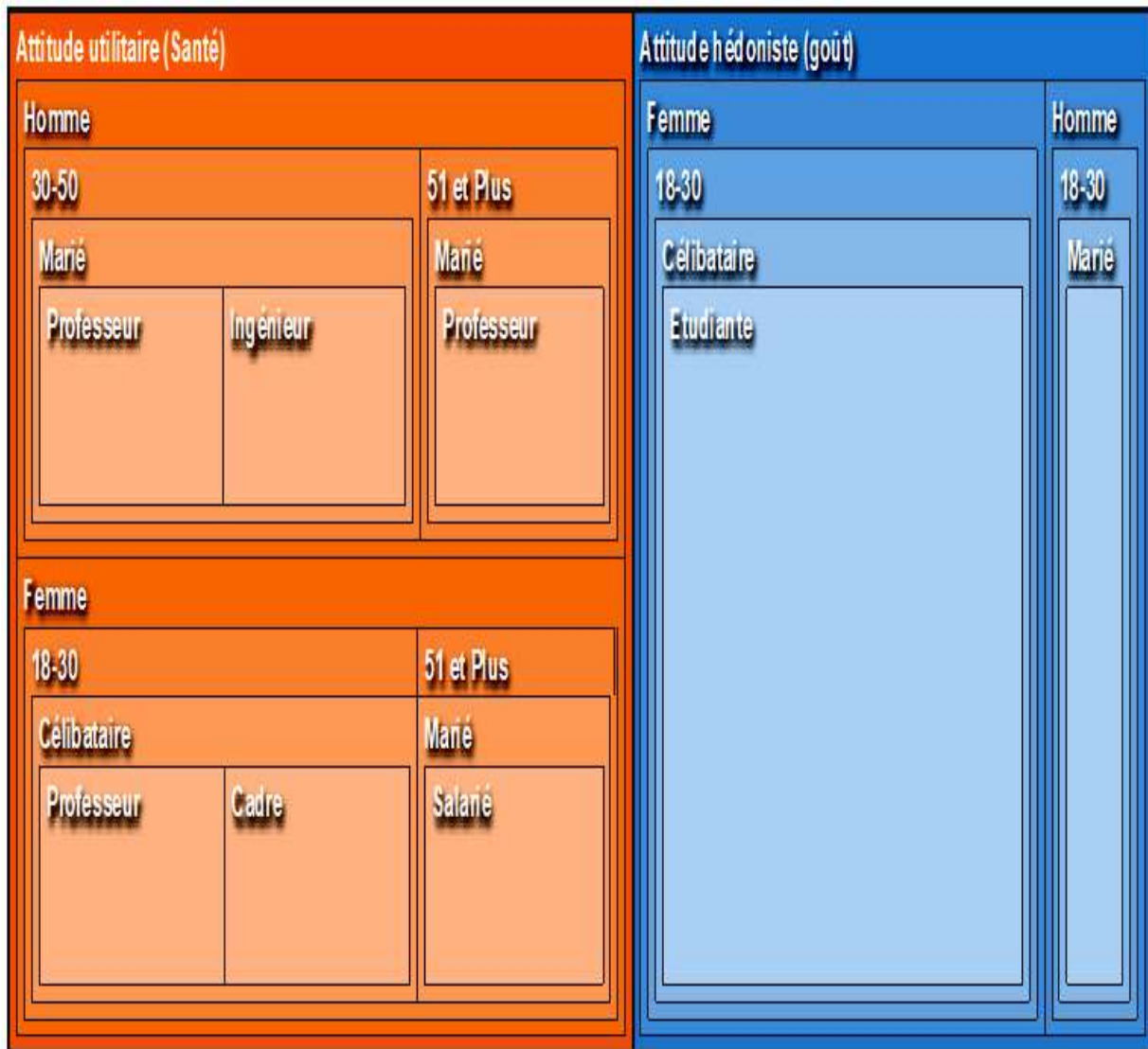
Figure 3: Proposition d'une typologie du consommateur marocain des aliments fonctionnels