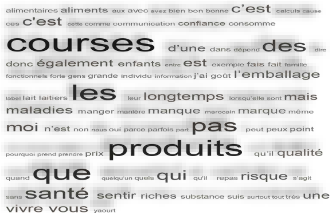
Figure 2: Requête de fréquences des mots

Une analyse lexicale des résultats a été menée pour mieux cerner les motivations de la consommation des aliments fonctionnels, comme l'illustrent les figures ci-après :