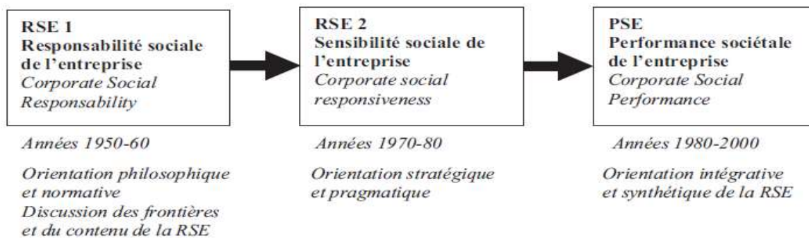
Figure2 : La construction théorique de la RSE

La figure ci-dessous résume l'évolution théorique du concept depuis les années 50 jusqu'aux années 2000.